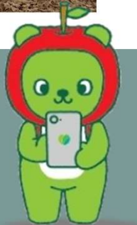
長野県PRキャラクター「アルクマ」

〒380-8570 長野市大字南長野字幅下692-2 長野県農政部農地整備課 表に「信州棚田フォトコンテスト作品 在中」と 明記してください。